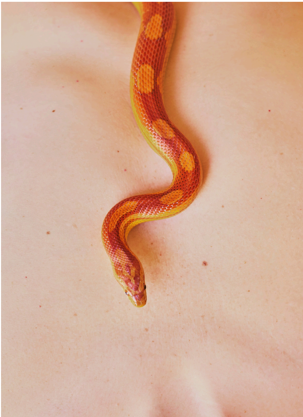
Snake & Skin, Hahnemühle Ultra Smooth 305g, 20 x 30cm, Contrecollage sur dibond 2mm