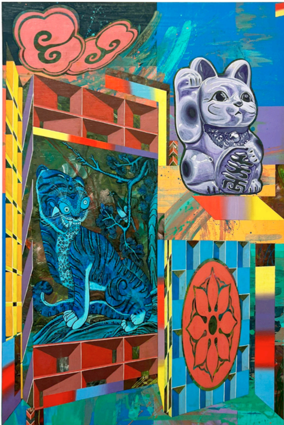
Defaced Vitrine 02, 2026 Dessin à l'acrylique et au stylo sur bois 61cm(w) x 91cm(h) x 3cm(d)