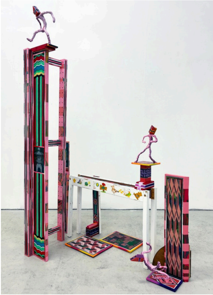
Epheremal Tableaux II, 2026 Acrylique et dessin au stylo sur objets trouvés 94cm(w) x 155cm(h) x 79cm(d)