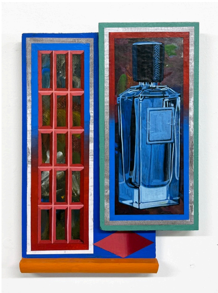
Annex Inventory 03_5, 2025 Dessin à l'acrylique et au stylo sur panneaux de bois, 23(w)cm x 33(h)cm x 4(d)cm