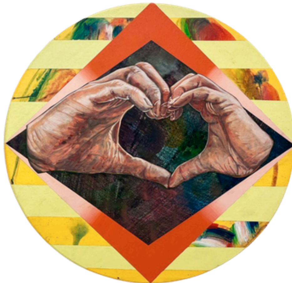
Echo of Us P.S , 2025 Dessin à l'acrylique et au stylo sur bois 30cm(w) x 30cm(h) x 3cm(d) x 2pieces,