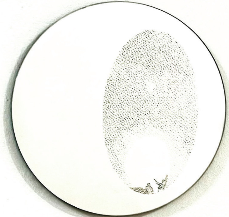
Illumination , 2025 Miroir gravé Diamètre 30 cm