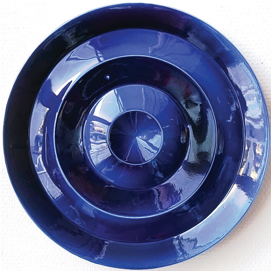
Aftermath V , 2025 Porcelaine, Cobalt, Diamètre 35 cm, épaisseur 4 cm