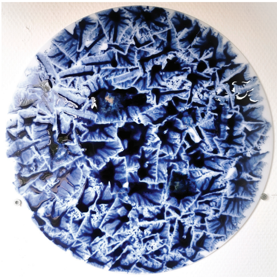
Pochade II, 2025 Porcelaine, Cobalt, Diamètre 40 cm, épaisseur 1 cm